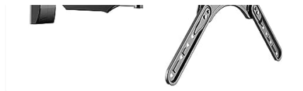
Suporte para Tv/Televisão SAV-4403 Triarticulado Padrão Vesa AQUÁRIO