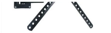
Suporte de Tv Tri Articulado Telesinal Ref. 3065-CX