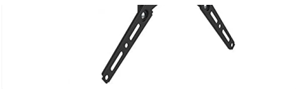
Suporte Tri Articulado TV de 13-55 Proeletecnic PQST-1355/02